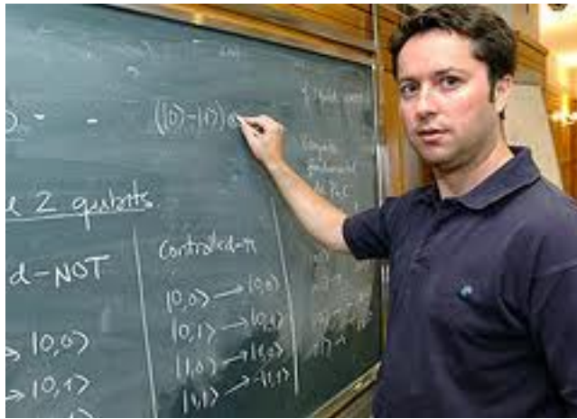
Juan Ignacio Cirac

L'Ignacio Cirac és un dels pioners de la computació quàntica. És, segons moltes traveses, el científic espanyol més ben situat per obtenir el Premi Nobel. Com a membre de l'equip deganal de l'FME, vaig tenir el privilegi (que vull agrair públicament) de compartir un dinar amb ell, quan va venir a fer una xerrada amb motiu de l'any Von Neumann.