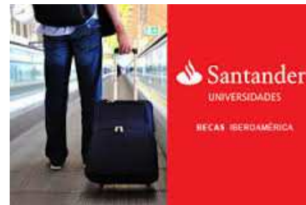
Beques Santander Iberoamèrica