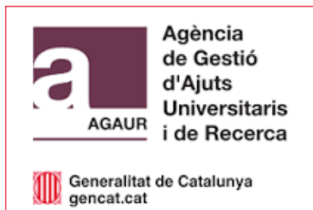
Ajuts MOBINT de l'Agaur