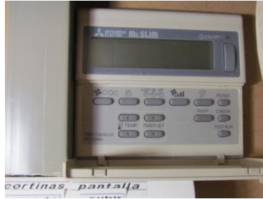
Controlador aire calent/fred